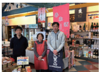
是非お気軽にお立ち寄りください