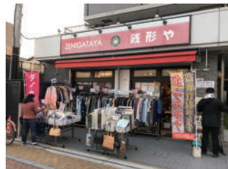
高砂みどりの街商店会にある店舗

草加駅の南東、西友の北側に位置する高砂緑の街商店会の一角にお店を構える「銭形や 草加店」。宝飾品や着物をはじめ多くのリサイクル用品を取り扱っているお店で、そう★か〜Doを有効にご活用いただいています。高価な品物も多くあるお店だからこそ、ポイントがすぐ貯まる。そして、それがまた次の購買意欲に繋がっていくという好循環で、率先してポイントを付与していただいています。