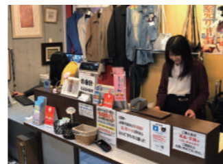
レジ横にはそう★か〜DoのPRも