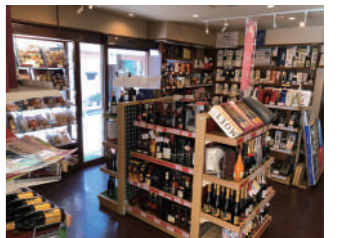
数多くの地酒が並んでいます