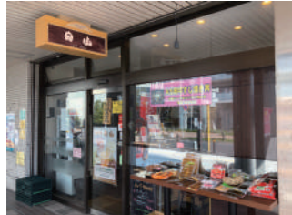
ハーモネスタワーの北西角にある店舗

獨協大学前駅西口のハーモネスタワーの北西にある、肉の日山は「安全・安心の素材屋」ならではの手間ヒマかけた手作り惣菜の販売でこの場所への移転開業から8年、地域の多くの皆様に利用されているお店です。お客様との会話を大切にしており、「肉の専門家」ならではのアドバイスはもちろん、日常会話など「個人店だからできる」お客様とのコミュニケーションをととても大切にしています。そんな、肉の日山では、 パパママ優待カードをお持ちの方に、そう★か〜Doのポイント を2倍にして付与しています。