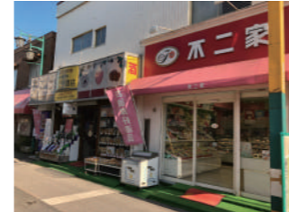
新田駅東口ロータリーの一角にある店舗

新田駅東口ロータリーの一角にある「はしぎや酒店」さん。「不二家」と並んで昔から多くの地元のの人に愛されているお店です。毎月8日・18日・28日には、 そう★か〜Doポイント2倍セール を実施しており、多くのお客様にお越しいただいているそうです。