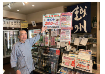
8・18・28日は2倍セール