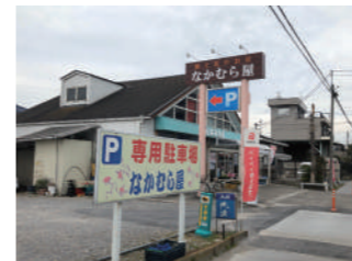
新里町の大通りに位置する

草加市新里町の老舗「なかむら屋」は、川口草加線新里町交差点の東側に位置し、地元の多くのお客様に利用される、お酒と花のスーパーです。