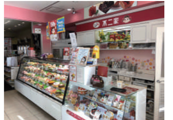
おなじみのケーキにもポイント付与

個店ならではの、「顔がわかるからこそ大切さ」が「周りの人たちと助け合う力になる」とお答えいただいた、地域密着のはしぎや酒店さんと不二家さんに是非お立ち寄りください。