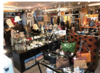
店内には魅力ある商品が陳列

最近では、ツイッターでの商品紹介やヤフーオークションへの出店も始めたそうで、欲しい物をリクエストすれば探してお客様に提供しているとのこと。欲しい物を購入して、そう★か〜Doのポイントを付加することができる「銭形や 草加店」さんを是非ご利用ください。