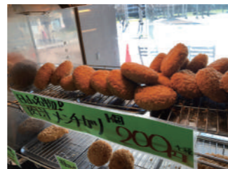
日山名物「肉汁メンチカツ」は絶品

加盟店インタビューは、そう★か〜Do加盟店へ取材に伺う企画です。そう★か〜Doを利用した各店舗独自の取り組みの紹介や、そう★か〜Doを利用して良かったこと、役に立ったことなどを、そう★か〜Do加盟店の皆様へお伝えしてまいります。