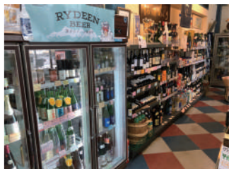
各地の地酒を伝えながら販売