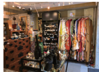
着物などのリサイクル品も充実